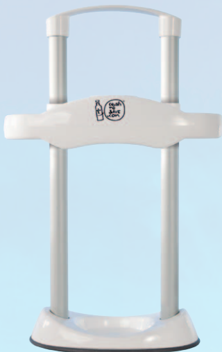
Blanc Opaque Ref. CTS-01